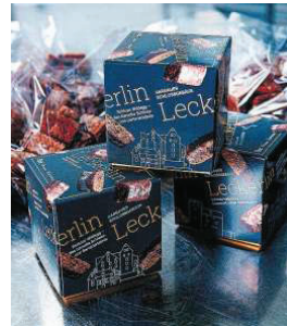
Wunderschön präsentiert: Leckerlin, das Aargauer Schlossgebäck.

Vielleicht muss der Trester künftig noch etwas besser gesiebt werden, bisser doch an der Degustation bei der Leckerlin-Präsentation im Schloss Hallwyl etliche Gäste auf harte Nusschalen.